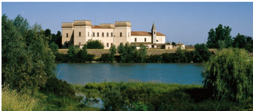
Mesola, Castello della Mesola

Partendo dal centro storico dell'affascinante città di Ferrara , si arriva al mare, a Gorino , in un lungo e straordinario itinerario che percorre l'argine destro del fiume Po e accompagna il fiume fino al suo delta. La lunga pedalata consente di apprezzare il paesaggio di pianura e di scoprire situazioni diverse per la flora, la